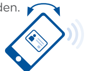
Twist & Go